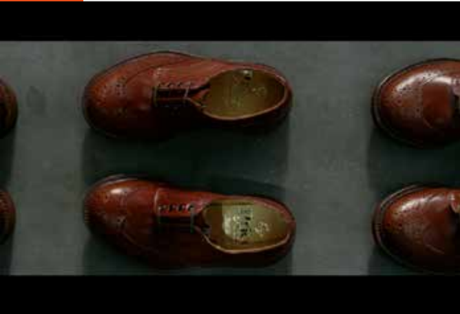
Resim 1: Price&Sons ayakkabıları

Durum Analizi: Price&Sons şirketi, Northampton’da 1895 yılında kurulmuş, aile şirketi olarak sadece klasik erkek ayakkabıları üretmektedir. İngiliz şirketi olduğu Price&Sons of England olarak ayakkabı kutularının üzerinde özellikle belirtilmiştir. Yine kutu üzerindeki “Shoemakers Since 1895” ifadesiyle de çekirdek işinin ayakkabıcılık olduğu da belirtilmiştir. Şirkette pazarlama anlayışı mevcut değildir. Satış, hatta ürün anlayışına odaklanılmış bir gelenekten gelmektedir. Büyük patron için pazarlama, oğlunun nişanlısıyla gideceği Londra’da, yapacağı işin adı olmasından öte bir anlam ifade etmez.